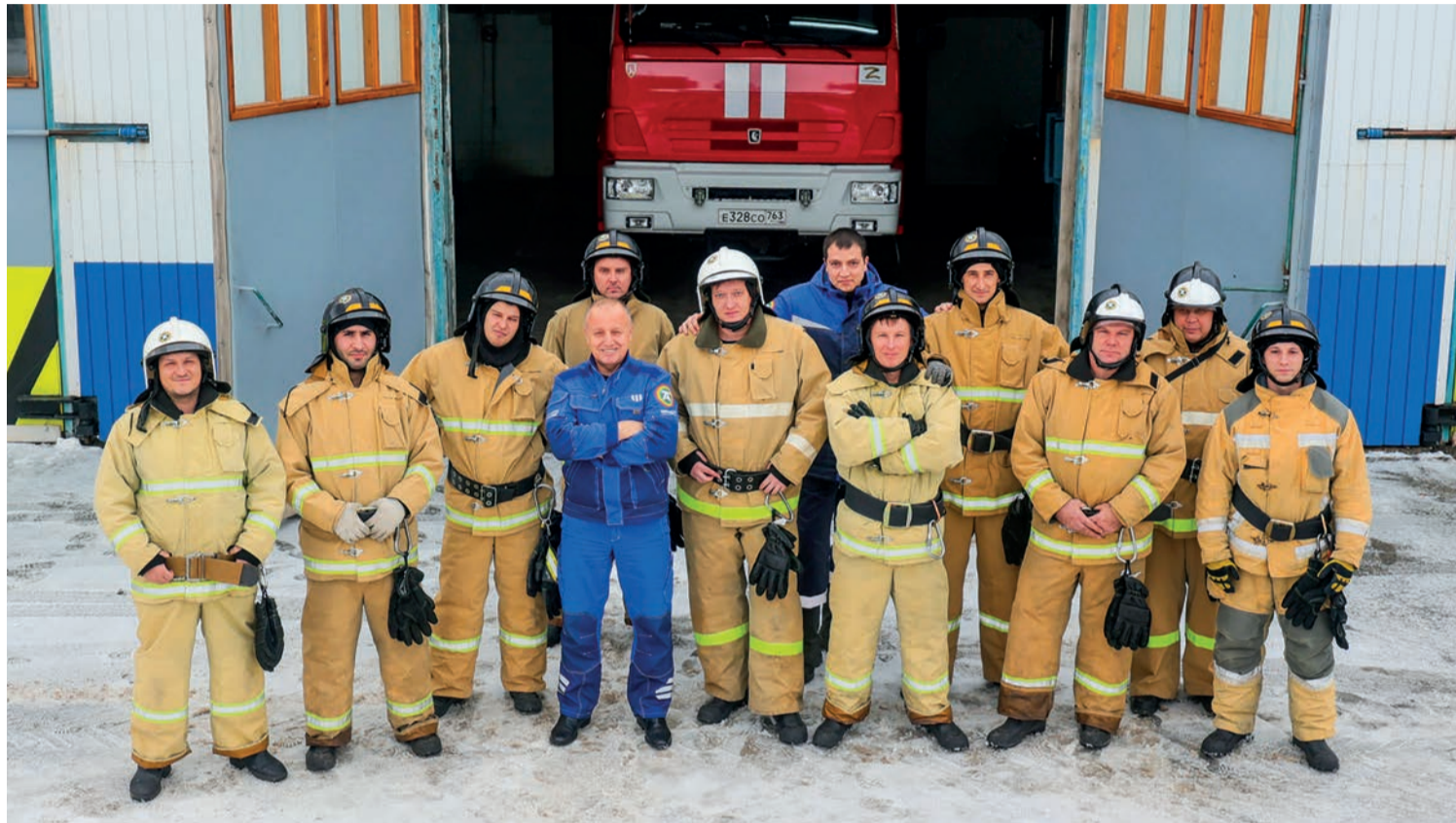
Пожарных на «Тольяттиазоте» 64. Они обеспечивают безопасность производственной площадки и всех социальных объектов