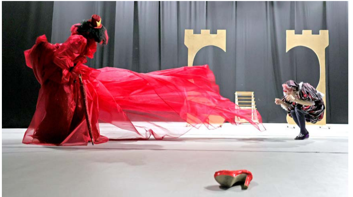
«Волжский химик» побывал на репетиции спектакля «Новогодние приключения Алисы» в ДК ТОАЗа

28 декабря в 19.00 джаз-оркестр под управлением Валерия