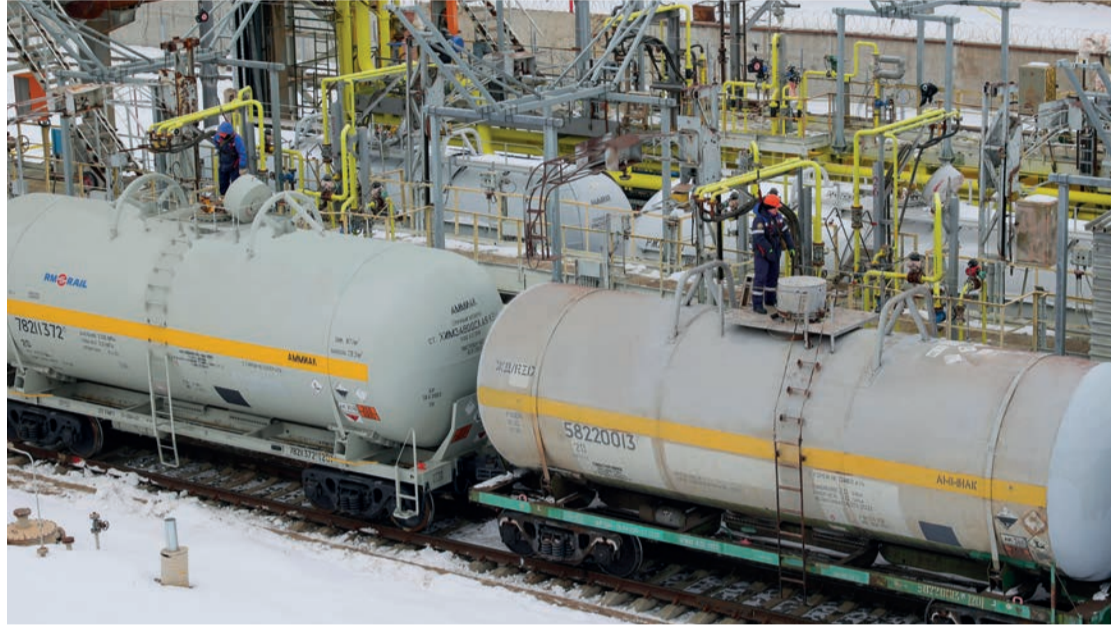
Цех подготовки аммиака к транспортировке – значимое звено в технологической цепочке

– В этом году многое сделано, чтобы увеличить отгрузку продукта железнодорожным и автомобильным транспортом, – рассказывает руководитель. – Появились насосы и трубопроводы для подачи аммиака на третий агрегат карбамида. Модернизируем наливные эстакады, устанавливаем новое оборудование: насосы, современные контроллеры налива. Увеличили объём налива аммиака до