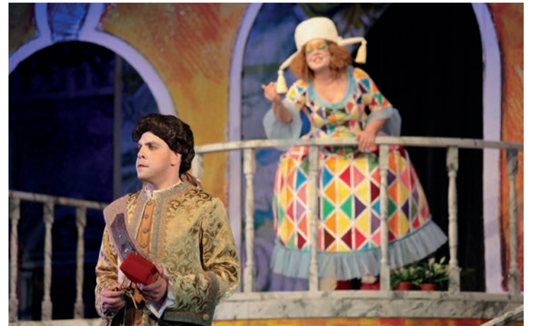
Дуэли, драгоценности, любовь и злодейство завершатся... пышными свадьбами. На сцене театра «Колесо» – комедия «Венецианские близнецы»

«Волжский химик» УЧРЕДИТЕЛЬ ГАЗЕТЫ – АО «ТОАЗ»