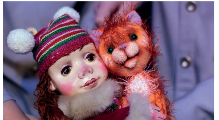
Не проходите мимо: котёнок ищет дом. Трогательную историю расскажут в театре кукол