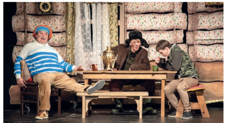
В постановке театра «Дилижанс» юные зрители особенно хвалят Матроскина